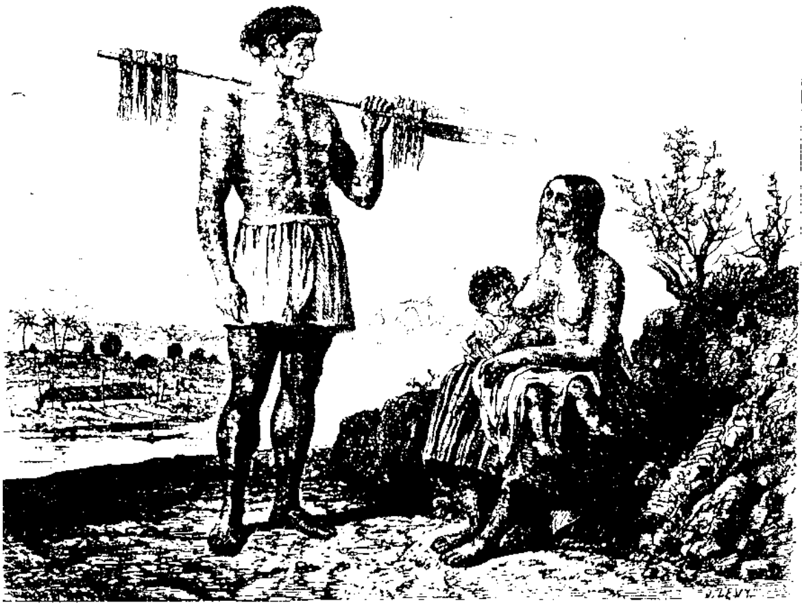
Figura 5. Índios Payaguá.