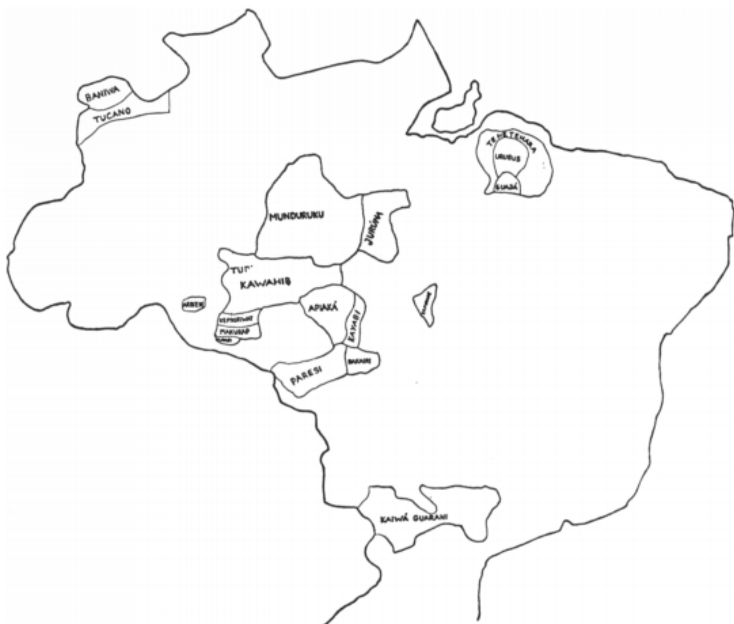
Localização dos Tenehara em relação a outros grupos tribais